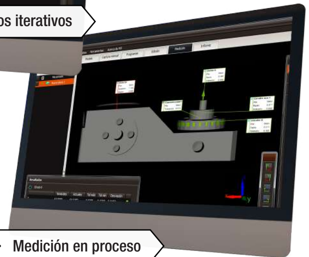
Medición en proceso