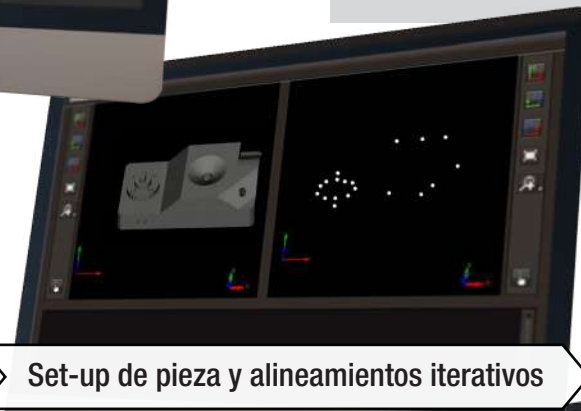
Set-up de pieza y alineamientos iterativos