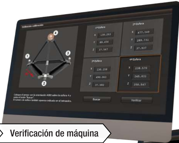
Verificación de máquina